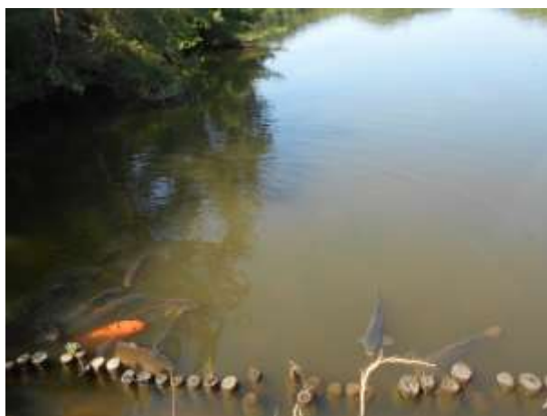
コイしか写っていないようですが真ん中にはウジャウジャいます

次会は7月中旬の予定です。皆さまのご参加お待ちしております。みんなでじゃぶじゃぶしましょう