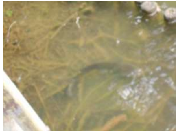
ピンボケですいません ナマズです 5~6匹の群れを目撃 30cm 以上