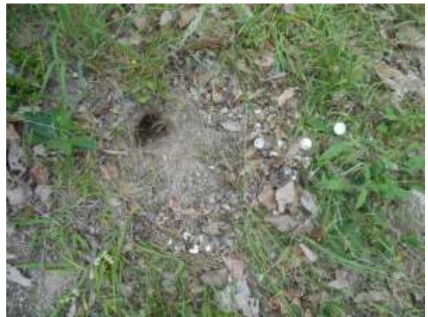
お散歩中のおじさんがおしえてくれました スッポンが産卵していたそうです 近くには殻がサンラン どなたが食ったの？