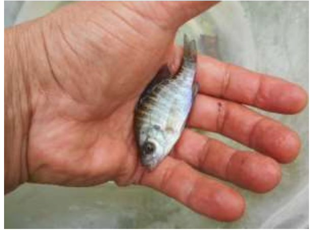
モンドリに入ってくれたブルーギル 7cm くらいのが2匹