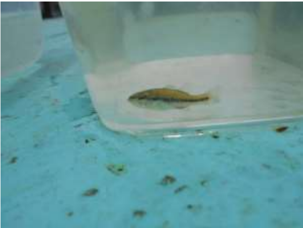
2~3cm のバス 2匹ゲット