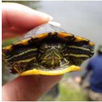
縁日ではいくらでしたっけ？