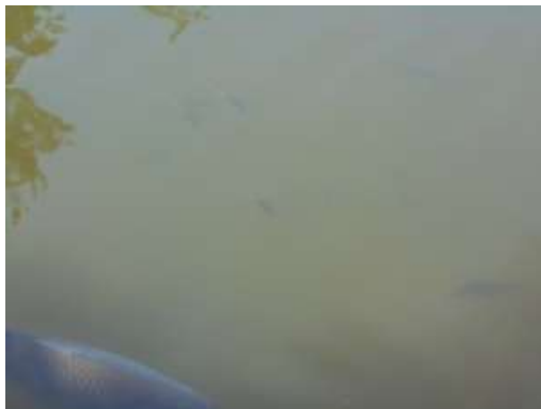
ブルーギルの魚影がでかくなってます