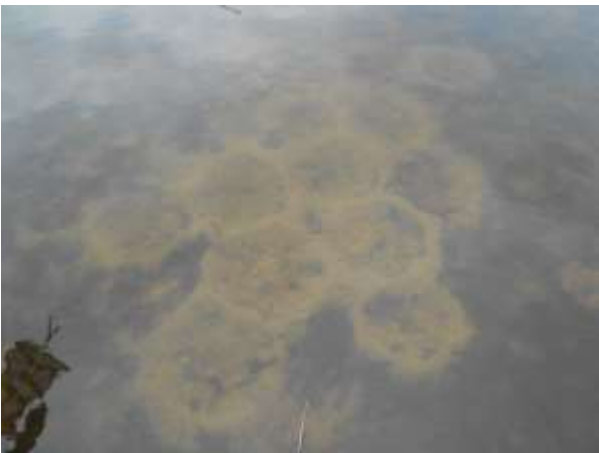
くっきりはっきりのギルサークル 野鳥の森付近の浅瀬