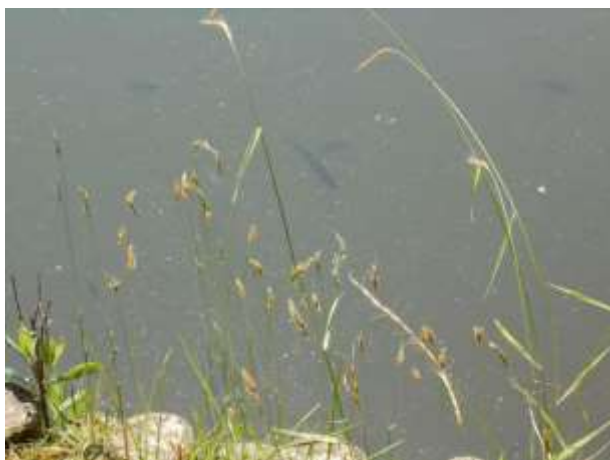
ギル稚魚もあちこちに