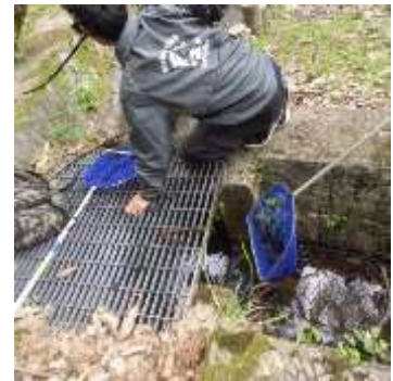
菖蒲園の側溝にザリガニ が 20 匹ほど