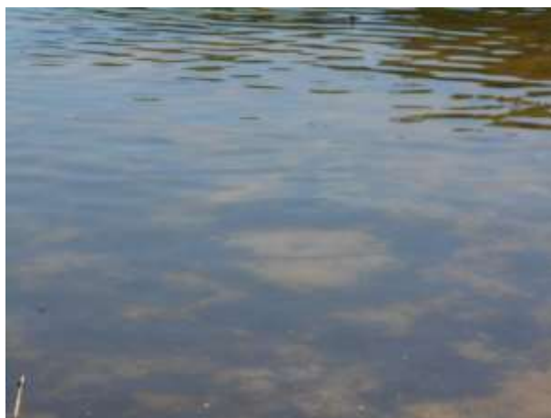
先週つぶしたギルサークルあとでも稚魚はいました